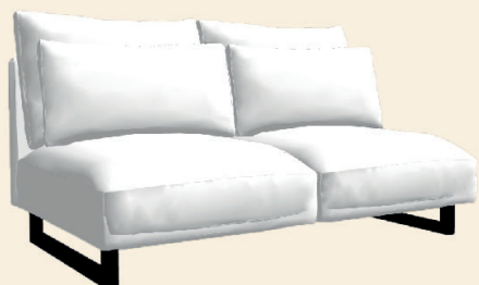
3 zit zonder arm 3 AL: 164x108