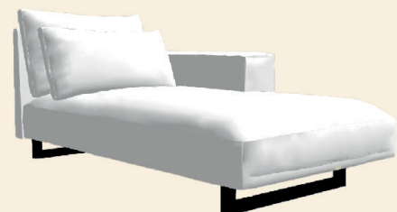
Divan Links/Rechts Divan L/R: 190x108