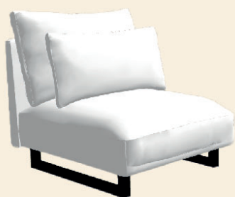
1 zit zonder arm 1 AL: 65x108