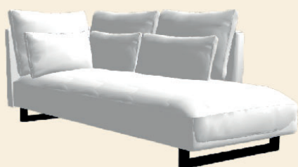
Ottoman Links/Rechts OTT L/R: 220x108