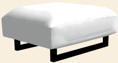
Hocker H: 82x62