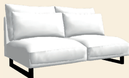
2.5 zit zonder arm 2.5 AL: 144x108