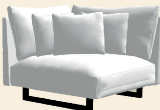
Hoekelement C: 108x108